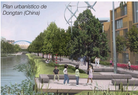
Plan urbanístico de Dongtan (China)

El idioma de trabajo de la conferencia será el inglés.